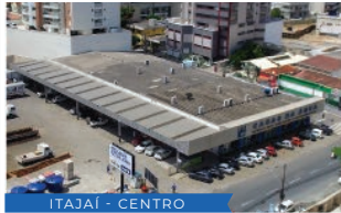
ITAJAÍ - CENTRO