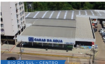
RIO DO SUL - CENTRO