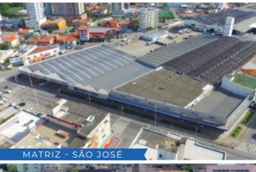
MATRIZ - SÃO JOSÉ