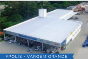
FPOLIS - VARGEM GRANDE