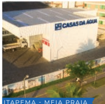
ITAPEMA - MEIA PRAIA