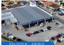
PALHOÇA - ARIRIÚ