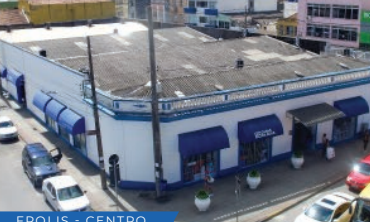
FPOLIS - CENTRO