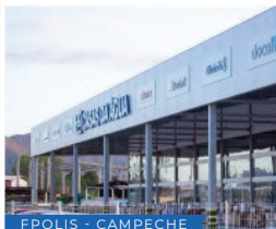
FPOLIS - CAMPECHE