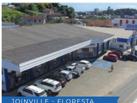
JOINVILLE - FLORESTA