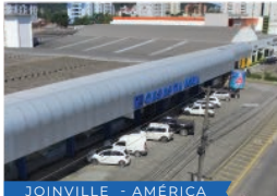
JOINVILLE - AMÉRICA