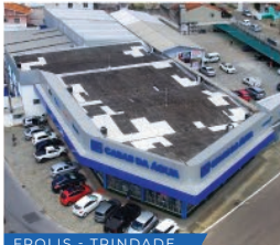
FPOLIS - TRINDADE