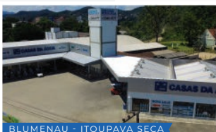
BLUMENAU - ITOUPAVA SECA