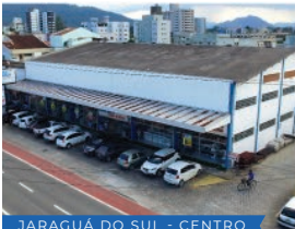
JARAGUÁ DO SUL - CENTRO