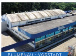
BLUMENAU - VORSTADT