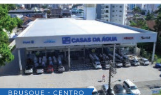
BRUSQUE - CENTRO