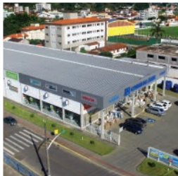
BIGUAÇU - UNIVERSITÁRIO