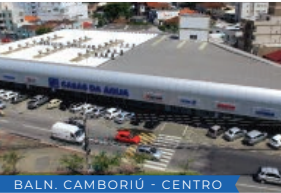
BALN. CAMBORIÚ - CENTRO